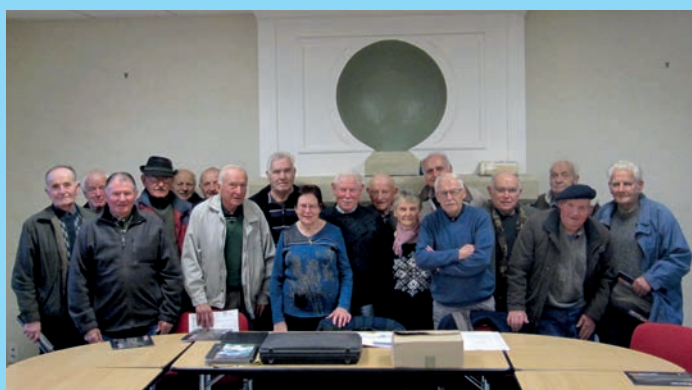
Assemblée générale de la FNACA.