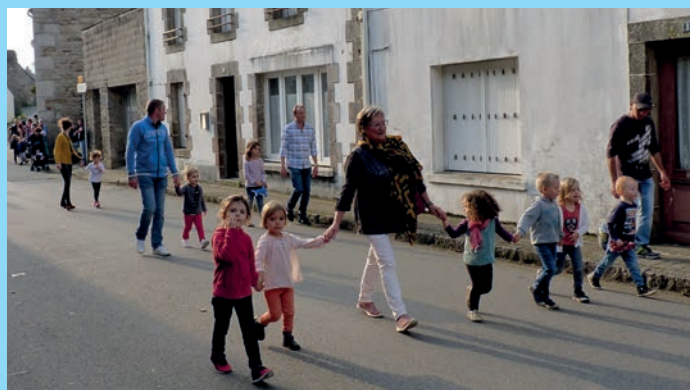
Course des enfants.