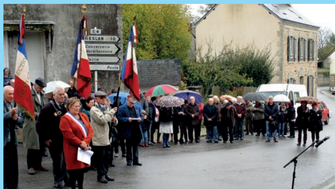
Commemoration du 11 novembre.