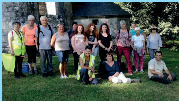
Pique nique du 14 juillet.