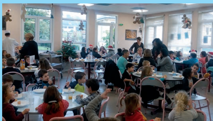
Repas de Noël à l'école.