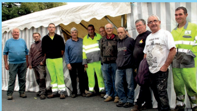
Bénévoles de la fête patronale.