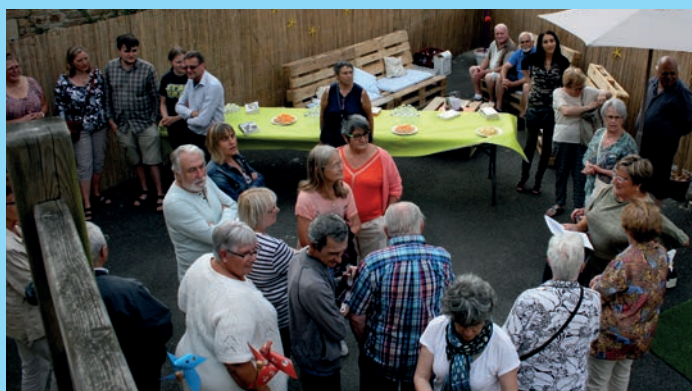
Pot des estivants du 13 juillet.