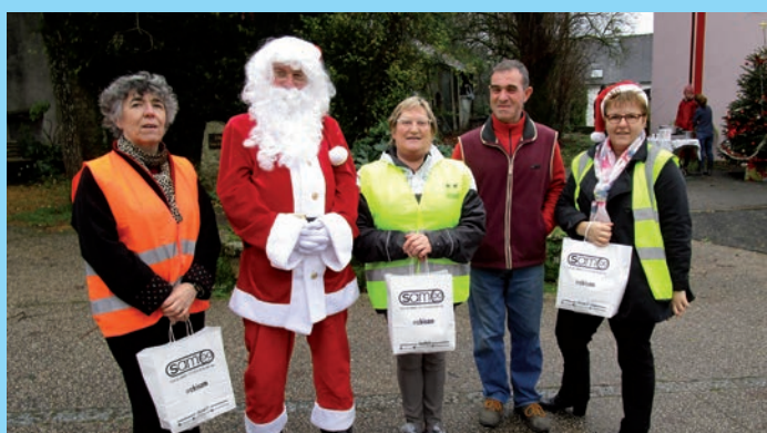
Opération de prévention routière.